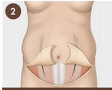
2 Músculos abdominales