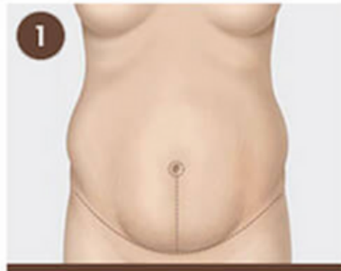
1 Insición vertical