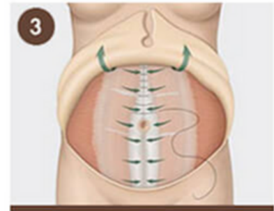
3 Cerramos la musculatura