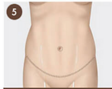
5 Se cierra la insición y se recoloca el ombligo a su posición normal